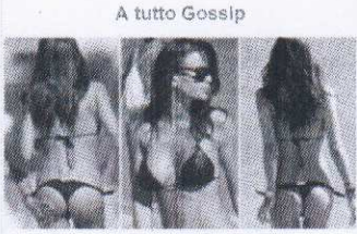
Tutto Gossip: guarda le foto più belle del gossip sportivo e non...

BrokerSer Case ville appartamenti in Treviso e in tutta Italia. www.casaatreviso.com